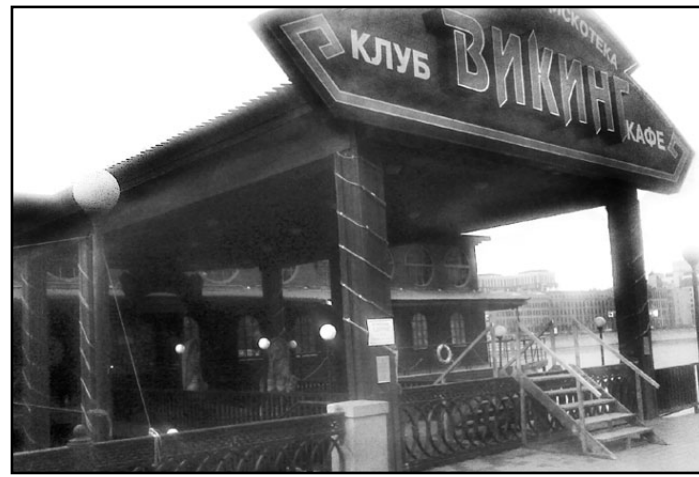
Кто мы-то здесь при чем? — разводит руками менеджер дебаркадера.

кушего года в 9 часов 30 минут вооруженные спецтехникой и под охраной милиции под видом восстановления чугунной решетки ограждения набережной заваривают вход на дебаркадер. Его сотрудники не растерялись, перекинули с «Викинга» через решетку лесенку. Посетителям кафе-ресторана даже стало интересно поглядеть в любимое место отдыха. Но буквально на днях приехала административно-